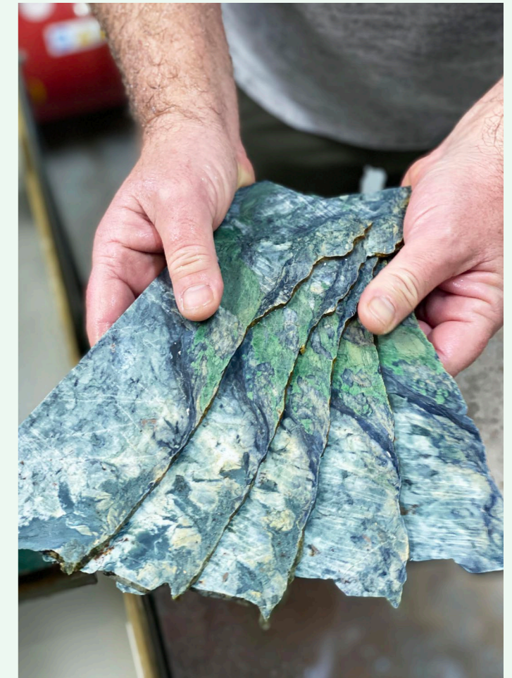
à gauche : détail du plateau de table en marqueterie de Vert d'Orezza et de bois locaux. à droite : découpes de croûtes d'extraction réalisés par Tanguy Martinez. ci-dessous : recherches de compositions en Vert d'Orezza associé à d'autres matériaux.