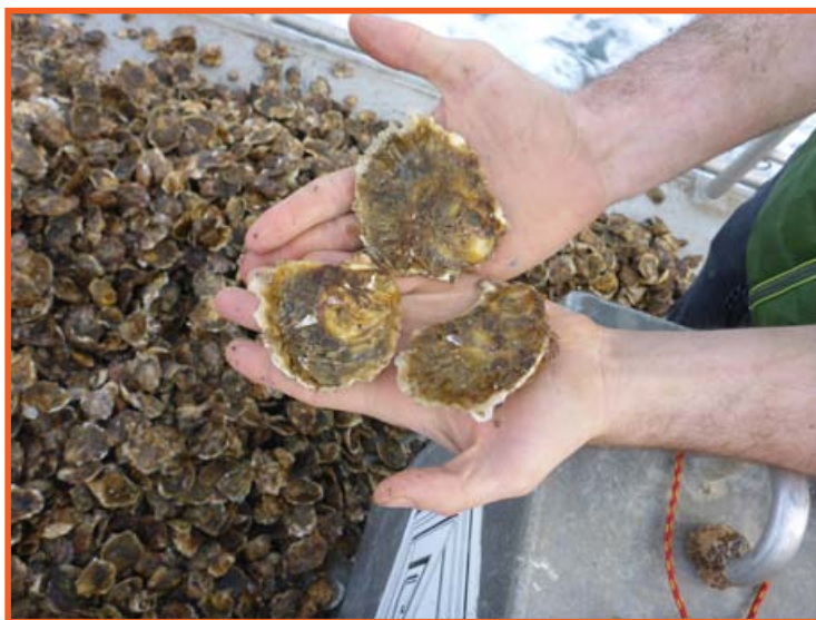
Les huîtres prêtes à être remises dans l'étang pour continuer leur croissance.