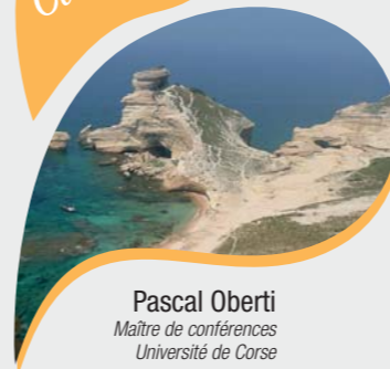
Pascal Oberti Maître de conférences Université de Corse

Le développement durable constitue un objectif ambitieux visant à concilier des dimensions multiples (la nature, l'économie, la société et la gouvernance), à articuler des temporalités (court, moyen et long termes) et des échelles spatiales (locale et globale). Les conceptions, les applications et les évaluations de l'atteinte d'un tel objectif constituent des éléments aux contenus variables. Les aires protégées, notamment les réserves naturelles marines, peuvent être des espaces de concrétisation du développement durable, particulièrement en Corse. Quels outils d'analyse, d'évaluation de la gestion et de vulgarisation des résultats pourraient être mobilisés à cette fin ?