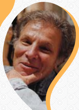
Louis-Jean Calvet Professeur émérite de sociolinguistique