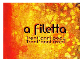
A Filetta trent'anni pocu, trent'anni assai