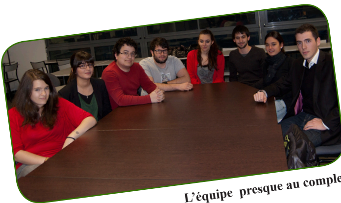
L'équipe presque au complet

Directeur de la publication : Vincent Stromboni Responsable de la rédaction : Pauline Verdi