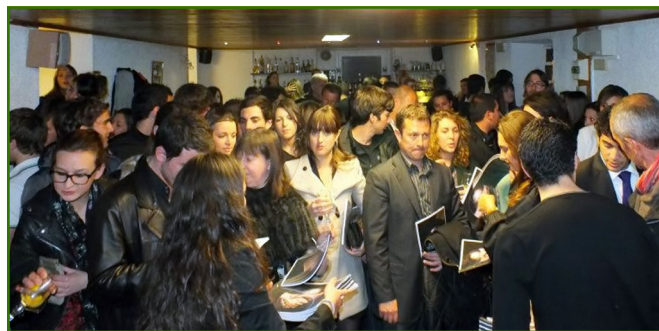
Poursuite de la journée à l'Oliveraie: distribution des livrets

Le 3 Avril dernier s'est déroulée la « journée GEA », à l'IUT di Corsica. Envisagée depuis un bon moment, cette journée s'est en fait organisée grâce à la combinaison de deux projets tuteurs : « Esprit GEA » et « Réseau GEA », qui ont travaillé côte à côte durant toute une année.