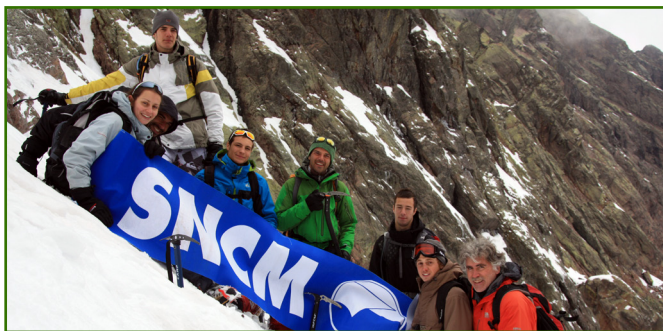
Une partie des étudiants s'entraînant pour l'ascension

Il y a maintenant quelques mois, des étudiants de la filière STAPS se sont lancés dans un projet encore jamais tenté à l'Università di Corsica : l'ascension du Mont Blanc.