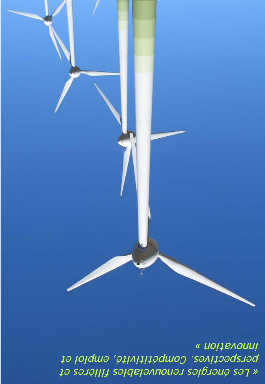
« Les énergies renouvelables filières et perspectives. Compétitivité, emploi et innovation »