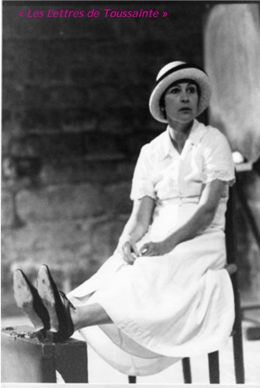
« Les Lettres de Toussainte »