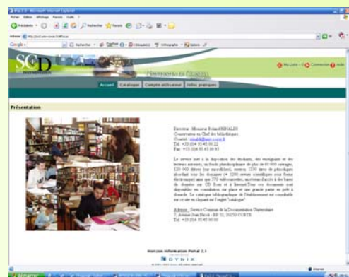
Le site internet de la BU

Le prêt des livres est entièrement informatisé. La consultation du catalogue de la Bibliothèque se fait par internet grâce à un lien sur la page de présentation de l'Université www.univ-corse.fr ou bien directement http://sdc.univ-corse.fr/ .