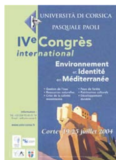
Page de presse