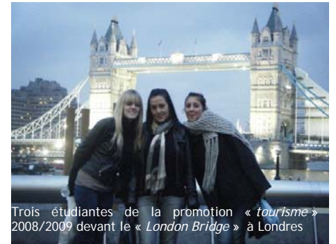
Trois étudiantes de la promotion « tourisme » 2008/2009 devant le « London Bridge » à Londres