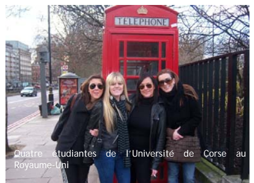
Quatre étudiants de l'Université de Corse au Royaume-Uni