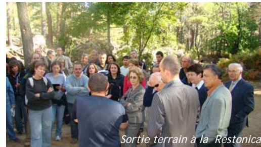
Sortie terrain à la Restonica