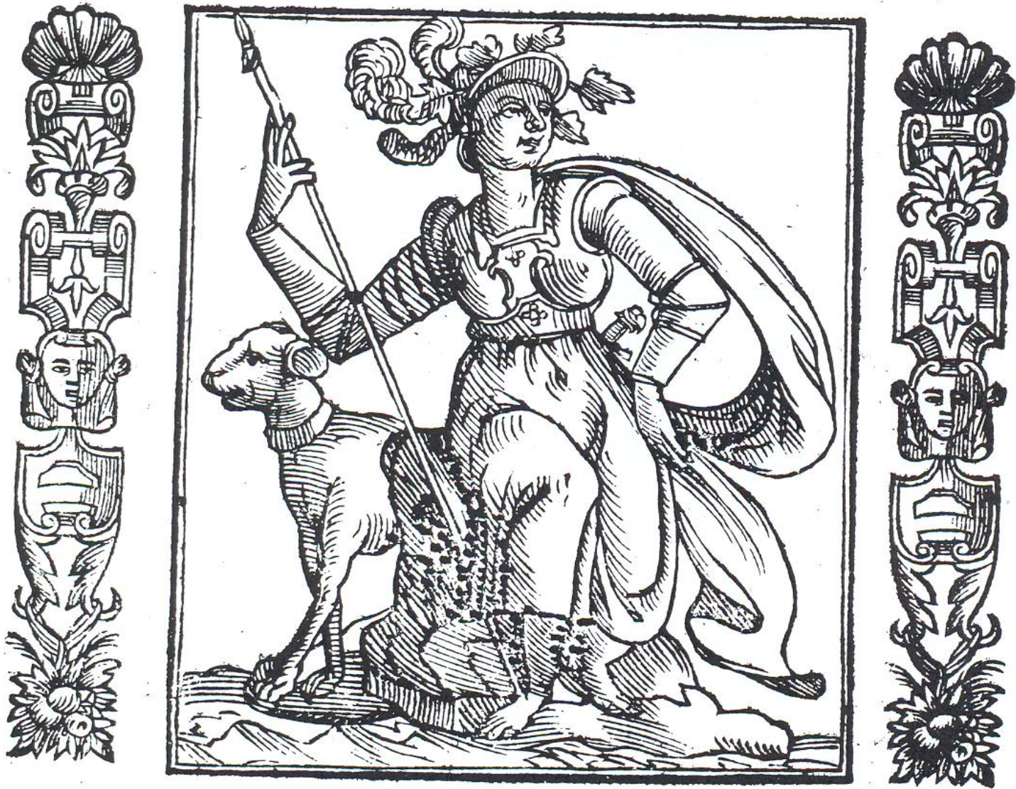
Fig. 7 – La guerrière dans l'Iconologia de Cesare Ripa (1613).