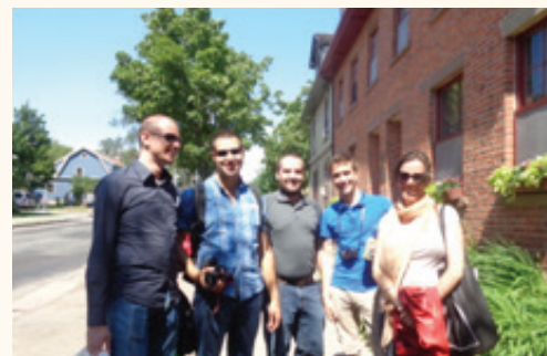
Des étudiants de l'Université de Corse et de l'Île du Prince Edouard

Une douzaine d'étudiants y ont participé, dont 4 étudiants de l'université de Corse. Les étudiants ont pu accroître leurs connaissances et expertise à travers des études de cas et d'une vive participation.