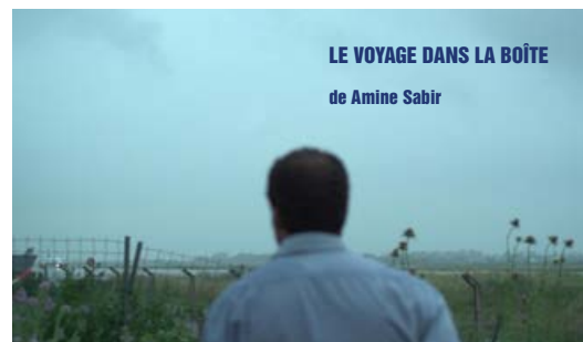
LE VOYAGE DANS LA BOÎTE de Amine Sabir