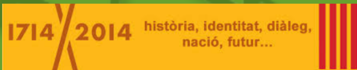
Logo de las manifestaciones del Tricentenario de los acontecimientos de 1714

« FÈNIX 11*23 », un título simbólico. Si la alusión al fénix alude tanto a la organización secreta del tomo 5 de la serie Harry Potter como a la ave mitológica que renace de sus cenizas –un guiño al destino político que desea Èric para Cataluña-, las dos cifras 11 y 23 remiten a dos fechas claves de la historia y de la identidad catalanas : el 11 de septiembre (la Diada, fiesta nacional de Cataluña que conmemora la derrota de 1714) y el 23 abril (día de la Sant Jordi, patrono de Cataluña).