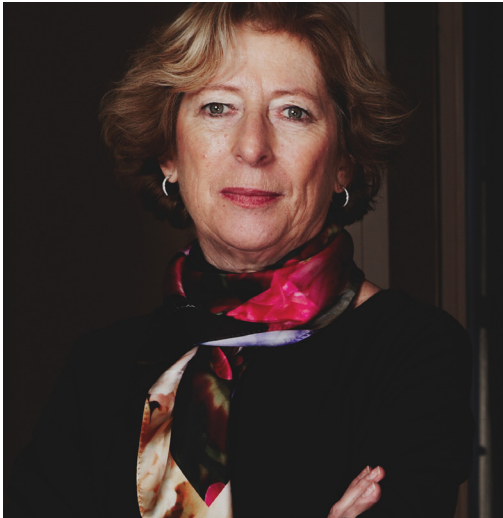
Geneviève Fioraso ministre de l'Enseignement supérieur et de la Recherche

Investir dans la connaissance et pour la jeunesse, c'est faire le pari de l'avenir. C'est faire le pari de la réussite étudiante, dans un pays où l'ascenseur social est en panne. C'est faire le pari de la compétitivité, dans un monde en pleine mutation technologique, scientifique, économique, sociétale, environnementale. C'est construire le nouveau « modèle français » qu'appelle de ses vœux le Premier ministre et que porte l'ensemble du Gouvernement.