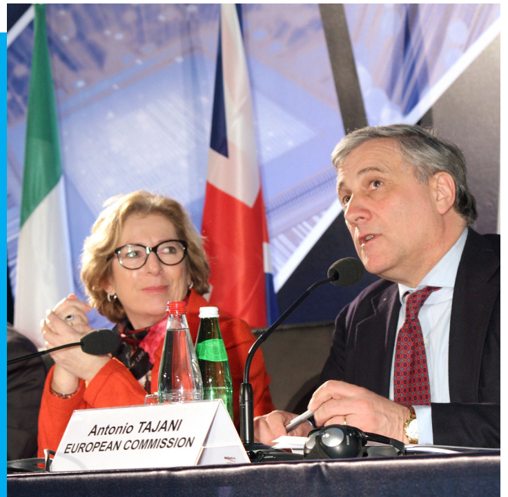
Science and Technology Ministers' Roundtable Meeting October 7, 2012 16:15-18:30, Conference Room A