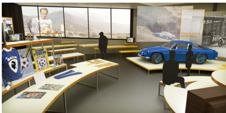
JOUER AVEC L'AUTRE, JOUER CONTRE L'AUTRE

EXPOSITION TEMPORAIRE « LES SPORTS EN CORSE » PHILIPPE DANGLES ARCHITECTE ESQUISSE 12 DÉCEMBRE 2011