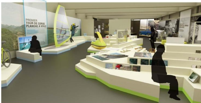
LES PIONNIERS FACE AU TOURISME DE MASSE

EXPOSITION TEMPORAIRE « LES SPORTS EN CORSE » PHILIPPE DANGLES ARCHITECTE ESQUISSE 12 DÉCEMBRE 2011