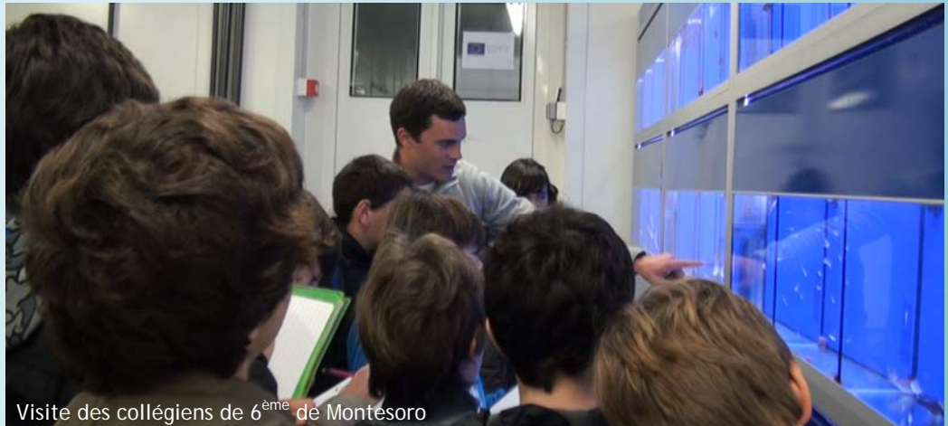
Visite des collégiens de 6 ème de Montesoro

Jeudi 19 janvier 2012, l'Università de Corse et le CNRS ont officialisé leur collaboration avec l'association U Marinu , à travers la signature d'une convention relative à Stella Mare , plateforme de recherche travaillant sur la biodiversité marine.