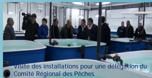
Visite des installations pour une délégation du Comité Régional des Pêches

Cette première visite en appellera plusieurs autres, il est en effet prévu de réserver une demi-journée hebdomadaire aux visites des professionnels, scolaires ou autre public à sensibiliser.