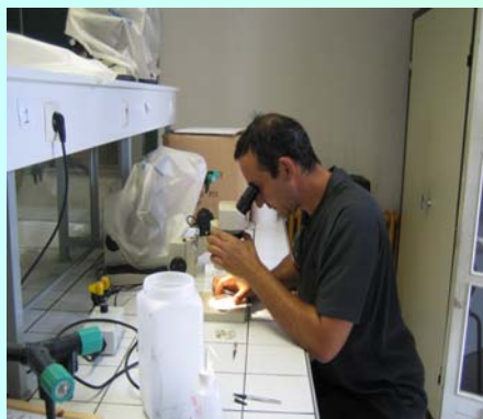
Travaglii pratici in sala

St'azione, realizzata cù a cullaburazione di a Cellula di Valurizzazione di l'Università di Corsica serà ricundutta l'annu chì vene per 8 altri persunali EDF.