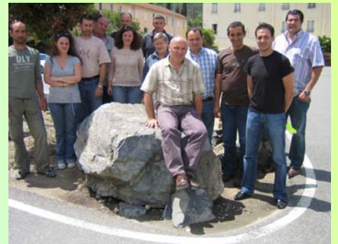
Le personnel EDF et l'équipe de pédagogique

Il s'agissait pour le personnel EDF de mieux appréhender le fonctionnement des écosystèmes d'eau courante, d'étudier l'impact des pollutions sur le milieu aquatique, ou encore de savoir