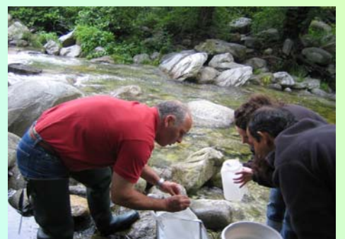
Séance pratique sur le terrain