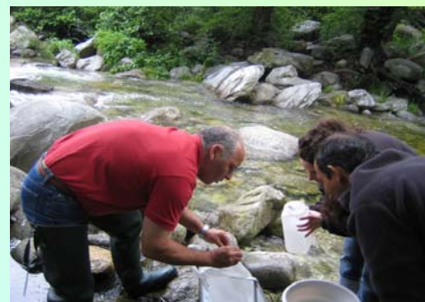
Seduta pratica nantu à u terrenu