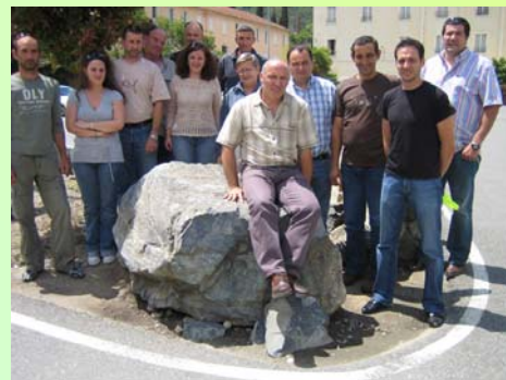
U persunale EDF è a squatra pedagogica

Si trattava per u persunale EDF di capisce megliu u funziunamentu di l'ecosistemi d'acqua currente, di studià l'impattu di e pulluzione nantu à u mezu acquaticu, o torna di sapè