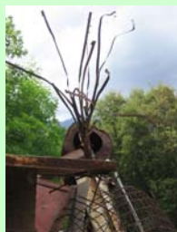
Studenti di a 1ma annata d'Arte "Scultura metallu"