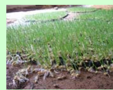
Edwige Koziello « Epis de blé »

Le rendez-vous est donné en 2008 pour une nouvelle exposition à Calacuccia, support grandiose pour des travaux plastiques sur la thématique de l'eau.