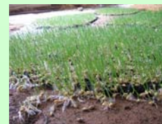
Edwige Koziello "spighe di granu"

U prossimu appuntamentu hè datu di u 2008 per una nova mostra in Calacuccia, puntellu maestosu per i travaglii nantu à a tematica di l'acqua.