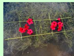
Anne Nocera « Sculpture d'eau, lac au Pantano, fleur hibiscus »

Elle a permis également d'évaluer la quantité de travail supplémentaire nécessaire à l'organisation et à l'exposition de travaux artistiques devant un public. Les étudiants en Arts Appliqués ont mesuré l'écart entre le monde des études et la vie professionnelle... Quelques uns comptent approfondir la démarche et se sont inscrits en Master Conception de projets culturels (CPC).